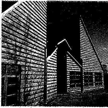
Vitlycke museum i Tanum, ritat av Carl Nyrén.

Allt detta finns nog där som ett nålstick, en eftertanke, men för mig är Carl Nyrén främst en pragmatiker som med sin hantverksbakgrund fångas av en ganska be-